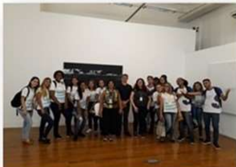
20/05 – SENAI (visita guiada) - tarde