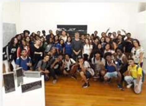
24/05 – Nilo Peçanha (visita guiada)