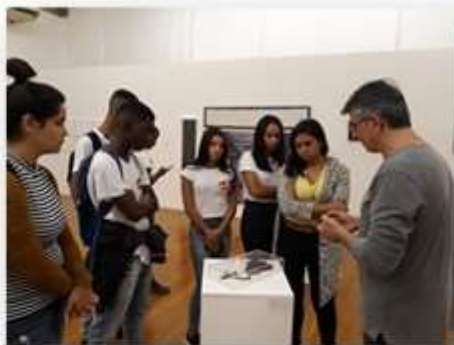
22/05 – ISBET (visita guiada)