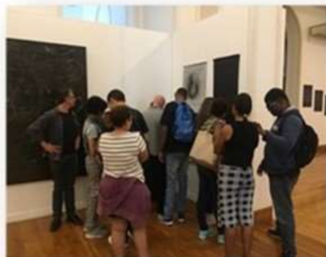
08/05 – IBC (visita guiada)