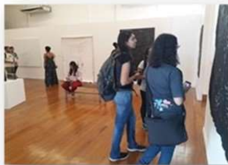
14/05 – UFF Biologia