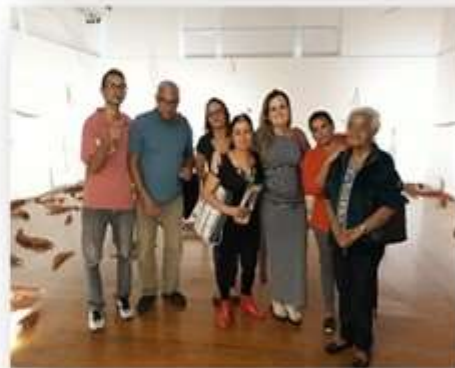
10/04 – Policlínica militar