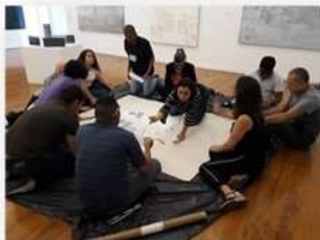
22/05 – IBC (visita guiada e Workshop)