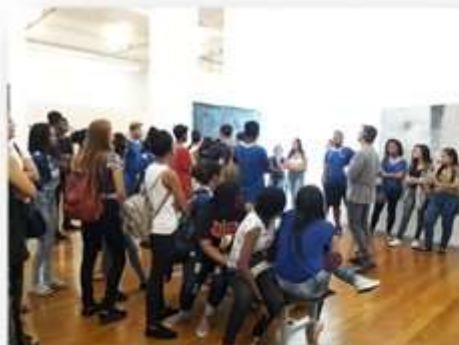
22/05 – Nilo Peçanha (visita guiada)