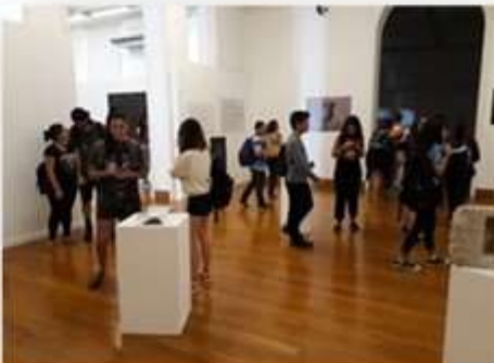
30/04 – UFF Turismo