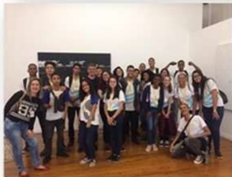
20/05 – SENAI (visita guiada) - manhã