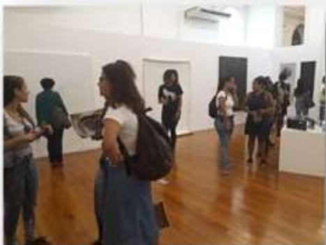
02/04 – Faculdade Anhanguera