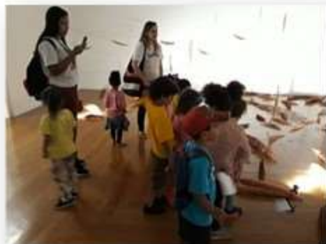
29/03 – SE SC