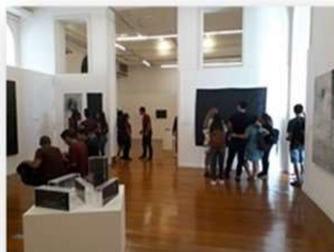
13/05 – Fac. Anhanguera