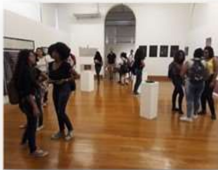
23/05 – SENAI